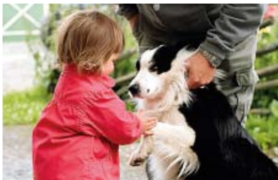
Agnes blir snabbt god vän med Rippo – en border collie vallhund.

siktigt och bara titta. Kossorna tittar nyfiket tillbaka.