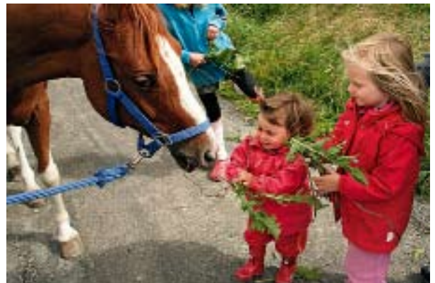
Hästen får lite mat innan avfärd.