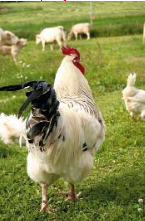
Tuppen Dolph är herre på täppan.